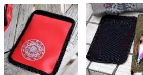
スマートホンケース 15cm×22cm